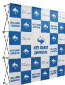
3×3 正面タイプ (巻込み無し)